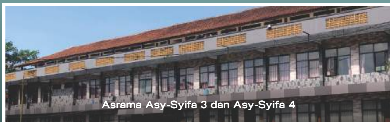
Asrama Asy-Syifa 3 dan Asy-Syifa 4