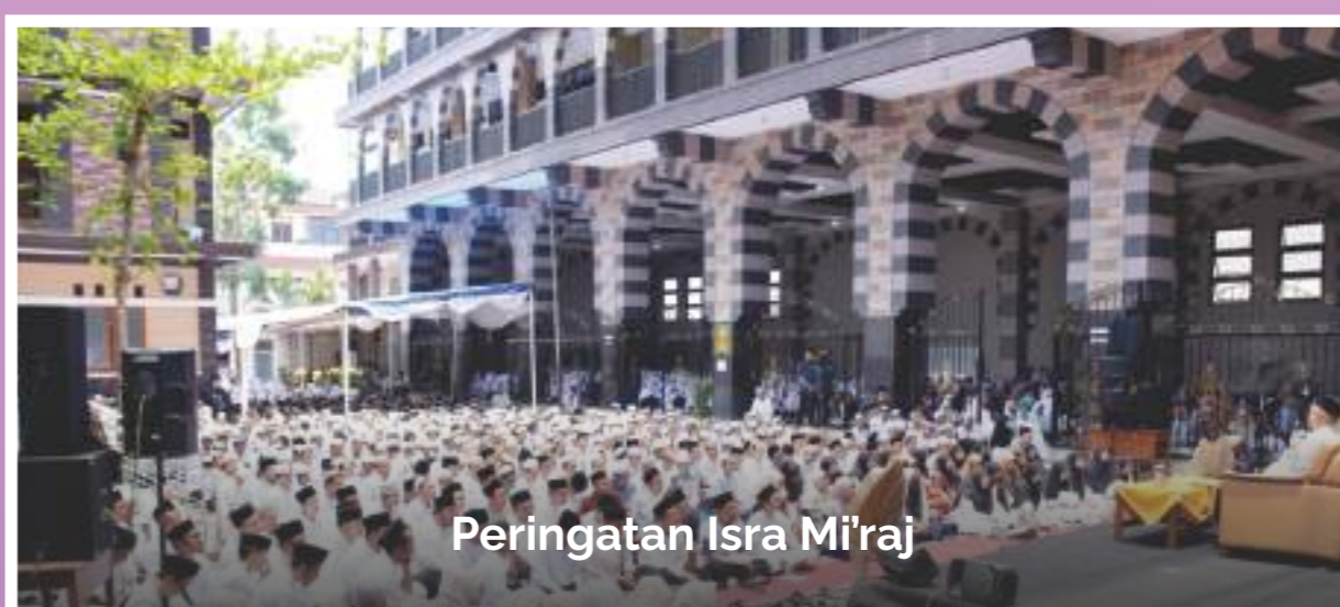
Peringatan Isra Mi'raj