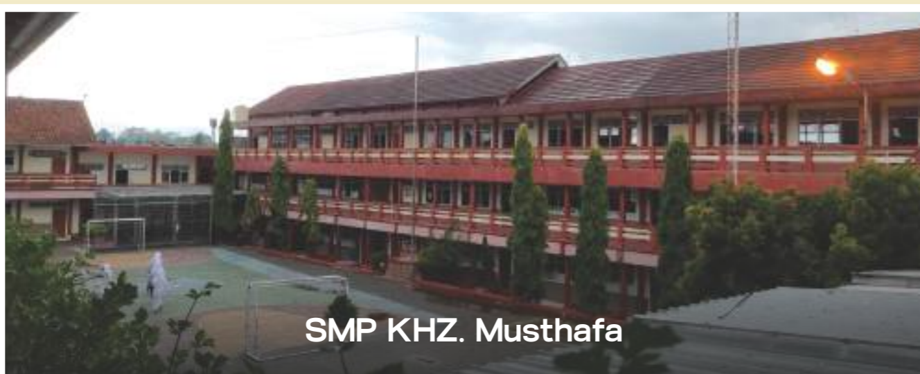
SMP KHZ. Musthafa