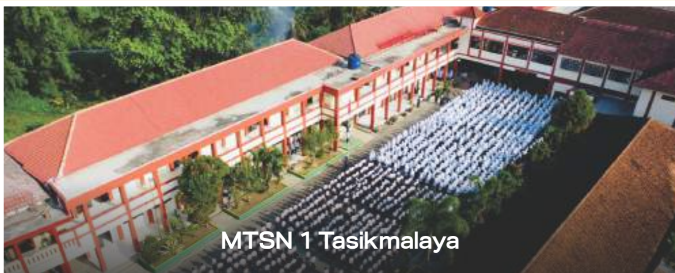
MTSN 1 Tasikmalaya