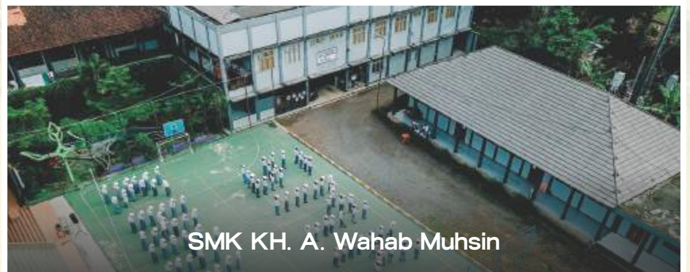
SMK KH. A. Wahab Muhsin