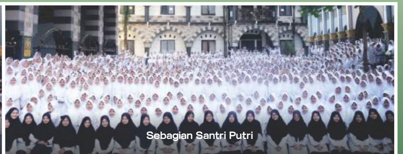
Sebagian Santri Putri