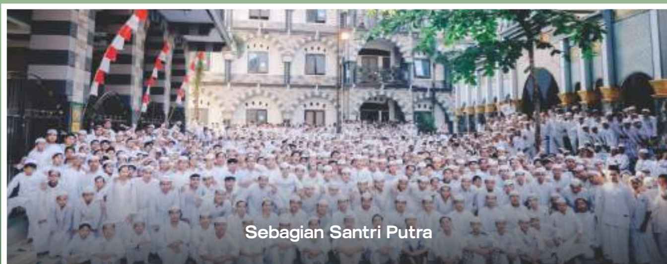
Sebagian Santri Putra