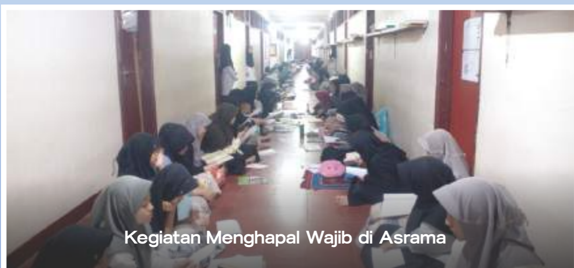
Kegiatan Menghapal Wajib di Asrama