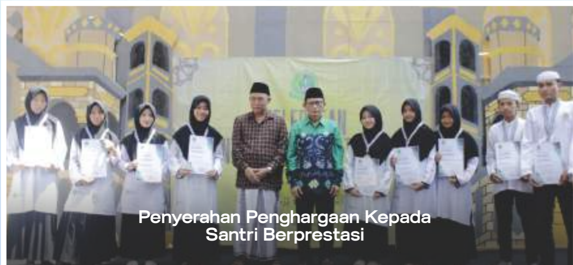
Penyerahan Penghargaan Kepada Santri Berprestasi

Sistem pengajaran yang diterapkan di Pesantren Sukahideng adalah sistem Klasikal, di mana santri ditempatkan pada kelas tertentu sesuai dengan tingkat kemampuannya berdasarkan hasil test klasifikasi, tidak berdasarkan tingkatan sekolah. Sedangkan Test Evaluasi Hasil