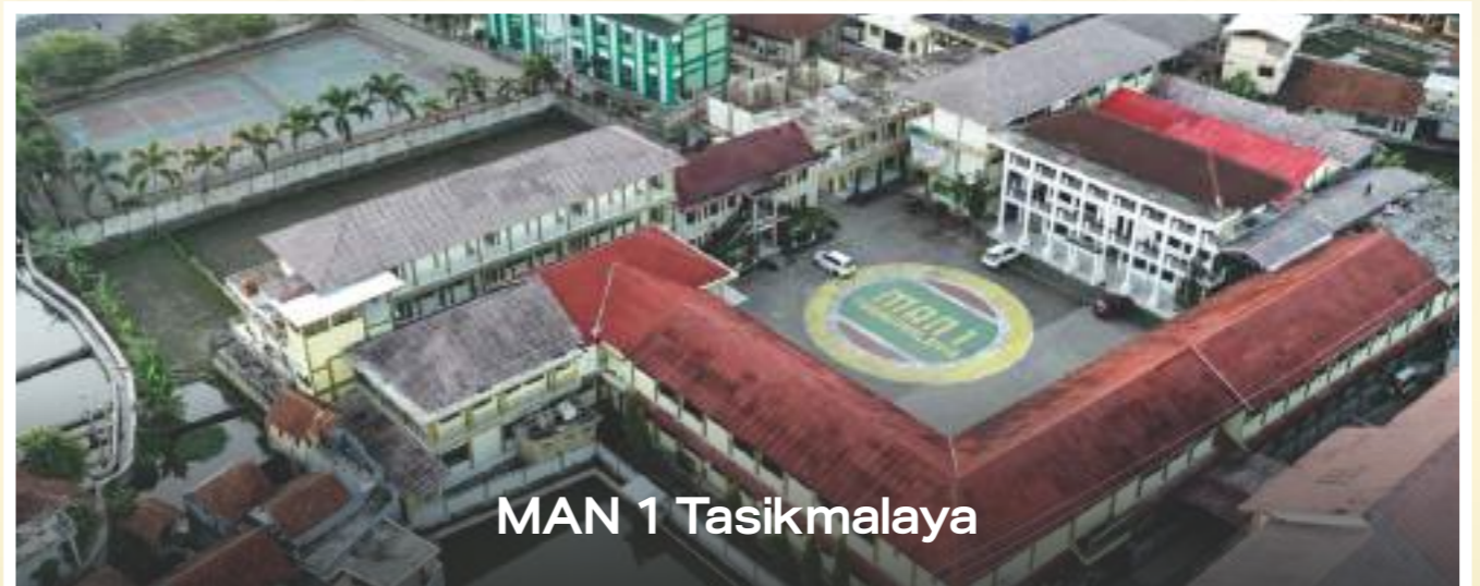
MAN 1 Tasikmalaya