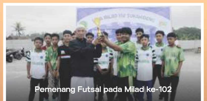
Pemenang Futsal pada Milad ke-102