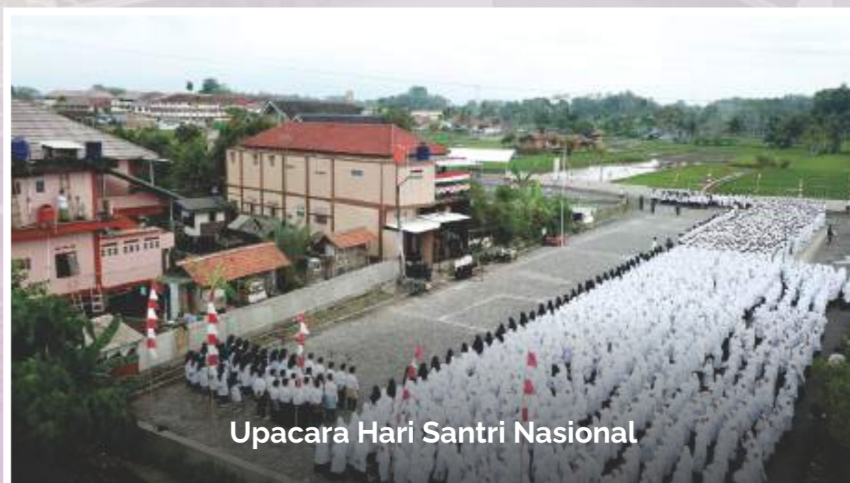
Upacara Hari Santri Nasional