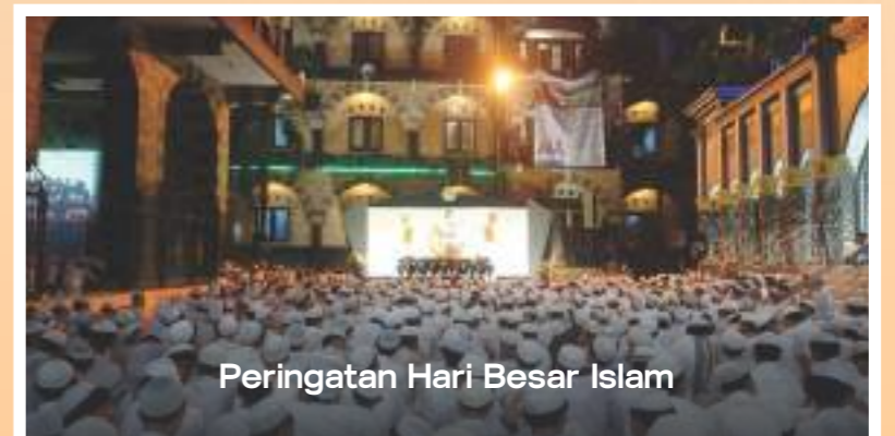
Peringatan Hari Besar Islam